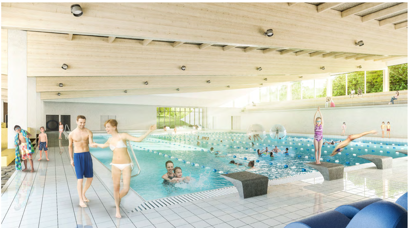
Het Vita Scheldebad in Temse

In de ideale situatie zal een optimaal functionerend ventilatiesysteem ervoor zorgen, dat het in een ruimte aangenaam van temperatuur is en dat de luchtkwaliteit gezond is. De temperatuurverdeling moet daarbij zo gelijkmatig mogelijk verlopen, zonder dat de indruk ontstaat dat het ergens tocht. Dat is nu mogelijk met Climotion® software voor klimaatinstallaties. Deze software is door Kieback&Peter ingebouwd in het DDC4000 regelsysteem. Hardware of software van anderen is hierbij niet noodzakelijk. Het systeem wordt compleet geleverd en in bedrijf gesteld door medewerkers van Kieback&Peter.