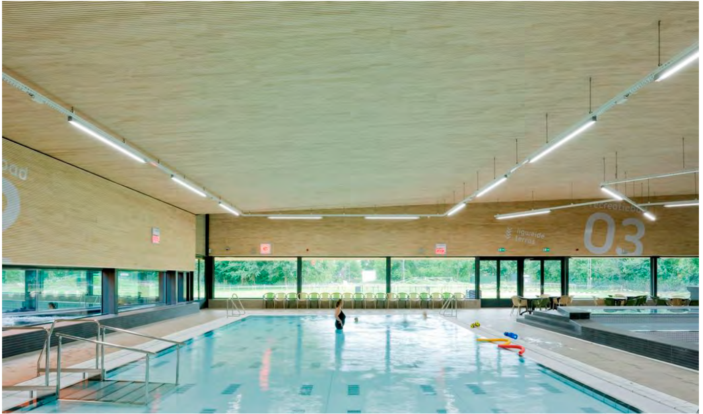
De Ijsselslag, Zutphen

Climotion® is geschikt voor alle ruimtes in zwembaden, inclusief in de zones van onderverdeelde ruimtes, waarin een homogene temperatuurverdeling mogelijk en gewenst zijn, ongeacht de grootte en de hoogte van de ruimte. De software is intussen al toegepast bij zwembad den Bessen in Mortsel en het Vita Scheldebud in Temse. In Nederland bij meer dan 15 zwembaden in Steenwijk, Utrecht, Dedemsvaart, Winterswijk, Vries, Leidschendam, Nieuwegein, Laren, Oosterhout, Beetsterzwaag, Noord-Scharwoude, Amsterdam, Zutphen, Voorthuizen, Hoofddorp en Bant.