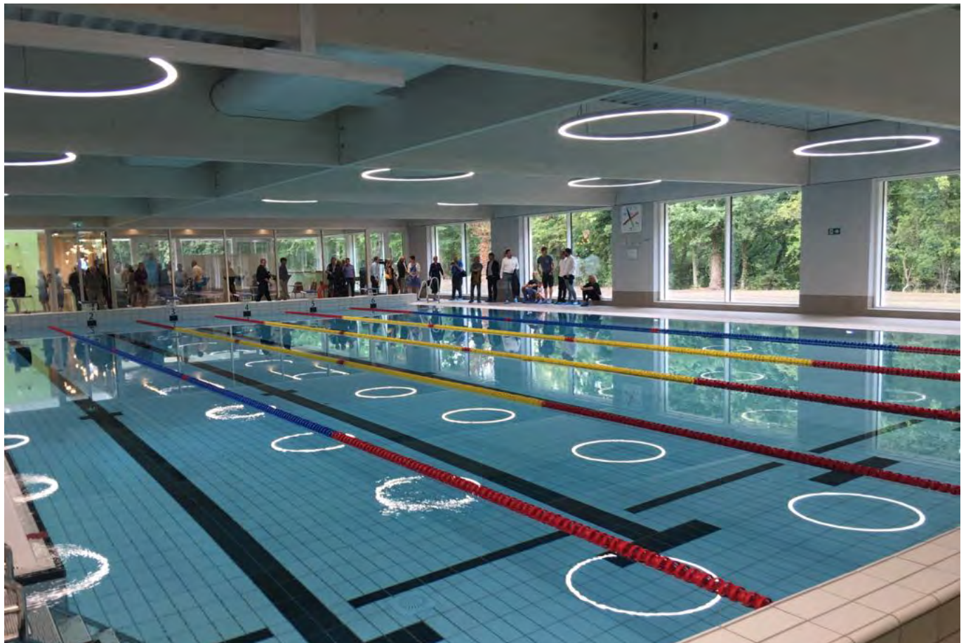
Zwembad den Bessen in Mortsel